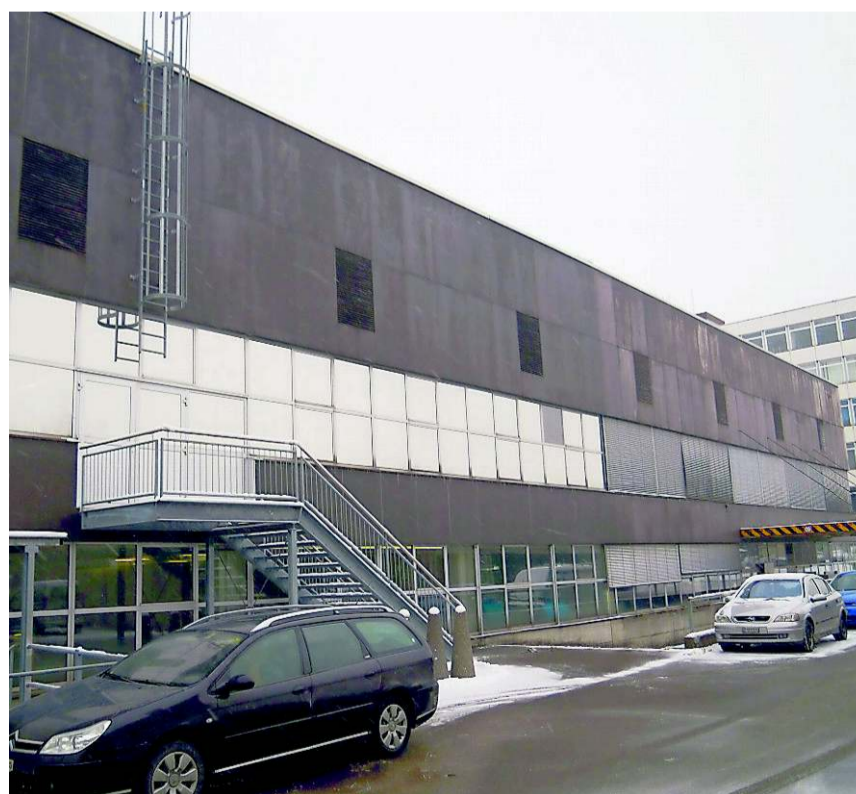
An der Gaswerkstrasse 35 zieht die Post in ein bestehendes Geschäftsgelände ein. Unter anderem sind dort schon Denner und Otto's drin. TG

Mit dem Umzug will die Post die Zustellung im Oberaargau effizienter gestalten. «Letzlich ist es eine Frage der Organisation. Wir versuchen immer, diese zu verbessern», sagt der Mediensprecher. Bisher wird die Arbeitsvorbereitung der Postboten in jeder einzelnen Poststelle vorgenommen – jetzt will der gelbe Riese diesen Prozess zentralisieren. Zurzeit wird die Brief- und Paketpost vom sogenannten Superzentrum in Härkingen